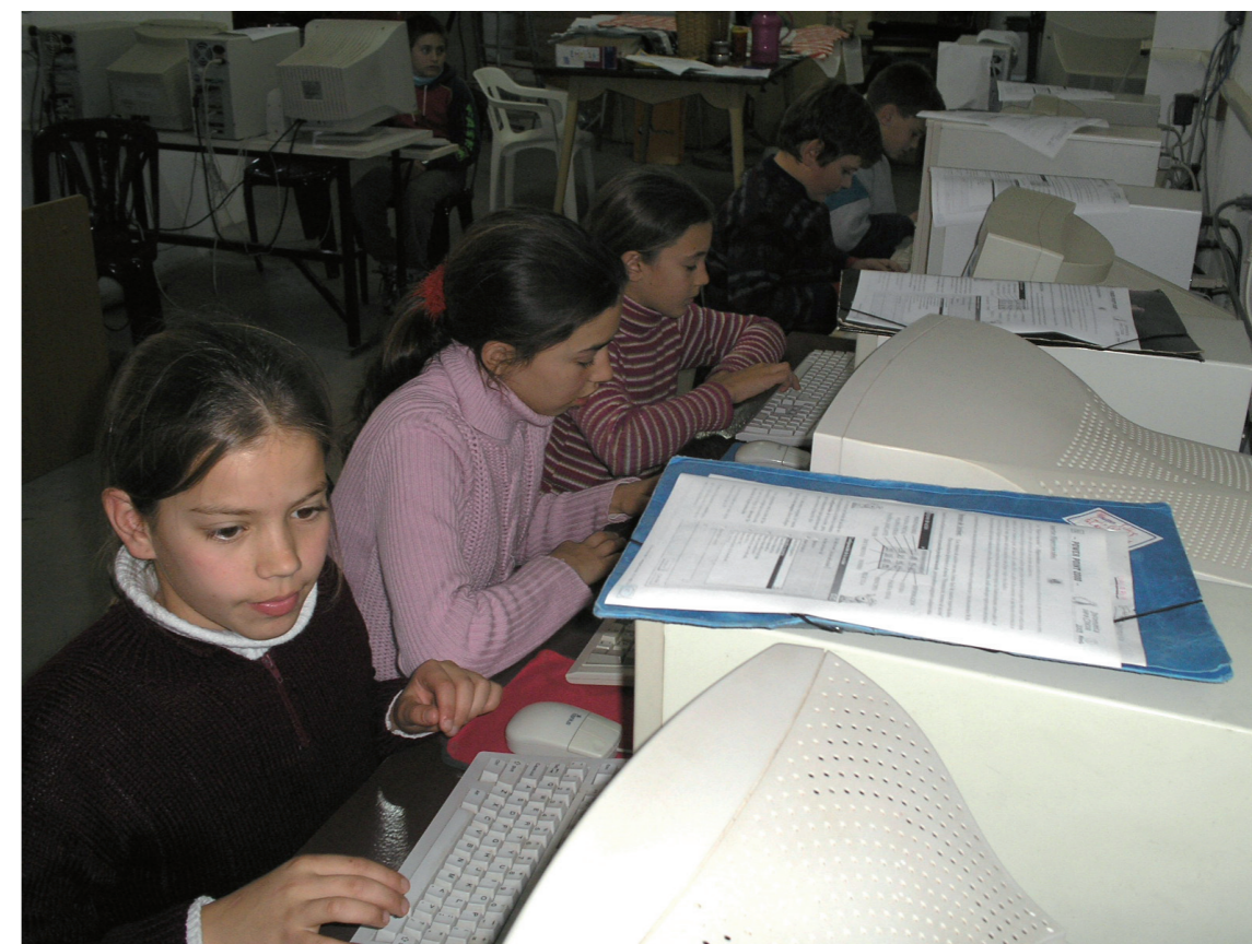
(El presente fragmento pertenece al libro “La escuela y la cuestión social. Ensayos de sociología de la Educación” Editorial Siglo XXI, Buenos Aires 2007).

qué es tan difícil garantizar el desarrollo de saberes poderosos en las nuevas generaciones. ■